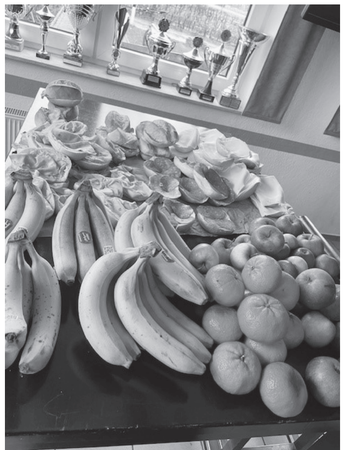
An der Verpflegung mangelt es nicht.