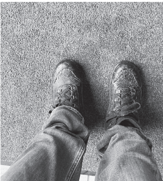
Ein wenig schlammig war es schon ....