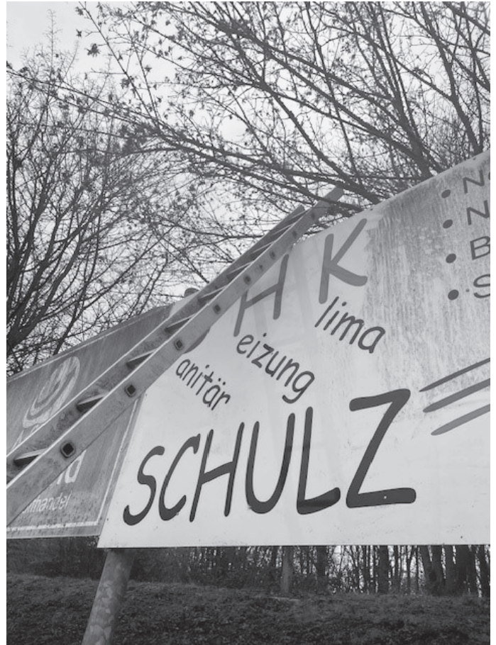
Vorher .... nachher. Die Bandenreinigung mit Hochdruckreiniger und Schwämmen war ein besonderes Vergnügen bei dem Wetter.