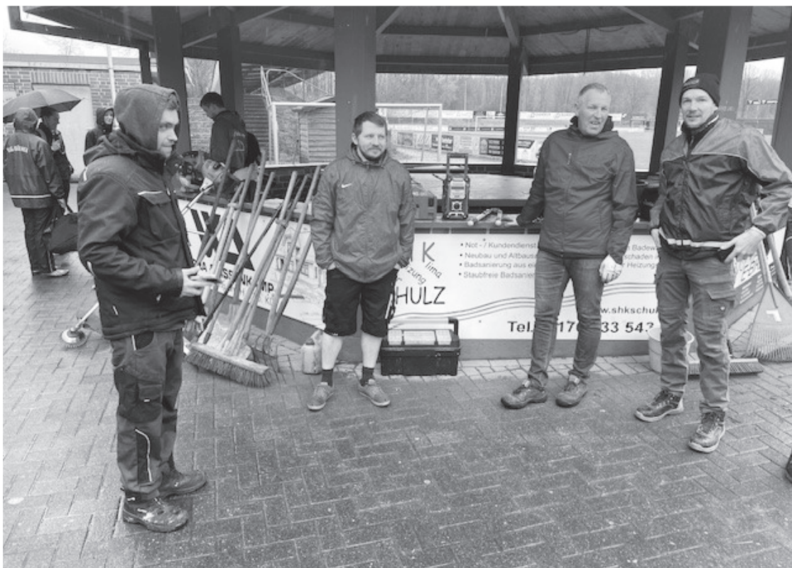
Die Helfer vor dem Einsatz sammeln sich.

Und sei es nur, wenn ich z.B. Kippen eben nicht auf den Boden schnippe, meinen Kram hinter mir her räume oder eben zweimal im Jahr mit anpacke.“